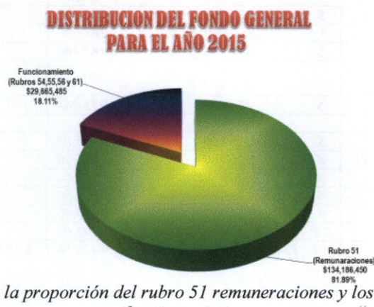
Grafico representativo de la proporción del rubro 51 remuneraciones y los rubros 54, 55,56 y 61 de funcionamiento.

El gráfico siguiente, demuestra la distribución del Anteproyecto de Presupuesto; donde el porcentaje mayor corresponde al rubro 51 remuneraciones por la cantidad de $134,186,450.00 que representa el 81.89% y el funcionamiento reflejado en los rubros 54,55,56 y 61 con $29,665,485.00 que corresponde al 18.11%, denotando un gran desbalance en el Anteproyecto de Presupuesto, en relación al funcionamiento de la Universidad.